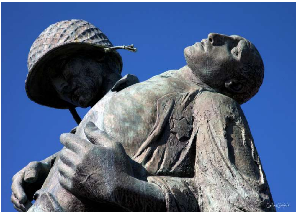
Fragment pomnika Liberation (Wyzwolenie) w Liberty Park w stanie New Jersey (1985).