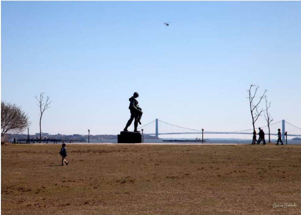
Pomnik Liberation (Wyzwolenie) w Liberty Park w stanie New Jersey (USA, 1985, brąz, 5 m) przedstawiający amerykańskiego żołnierza niosącego wyzwolonego więźnia obozu koncentracyjnego.