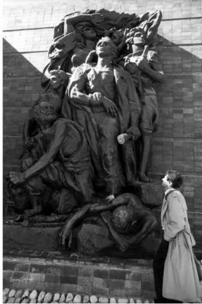
Pisarz Jerzy Kosiński przed pomnikiem Bohaterów Getta w Yad Vashem w Jerozolimie, 1988 r.