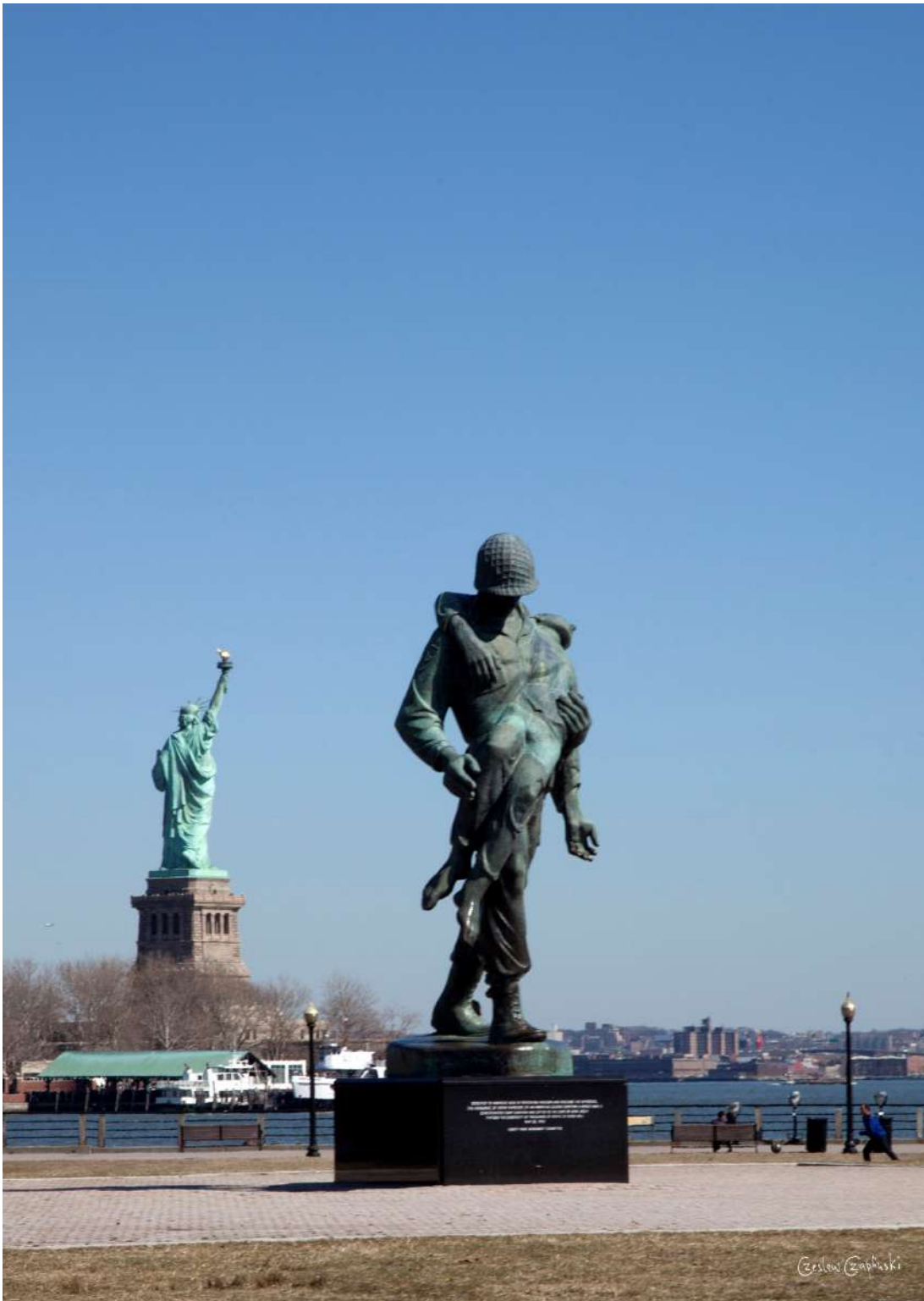
Pomnik Liberation (Wyzwolenie) w Liberty Park w stanie New Jersey (1985), w tle słynna Statua Wolności, witająca przez lata emigrantów z całego świata.