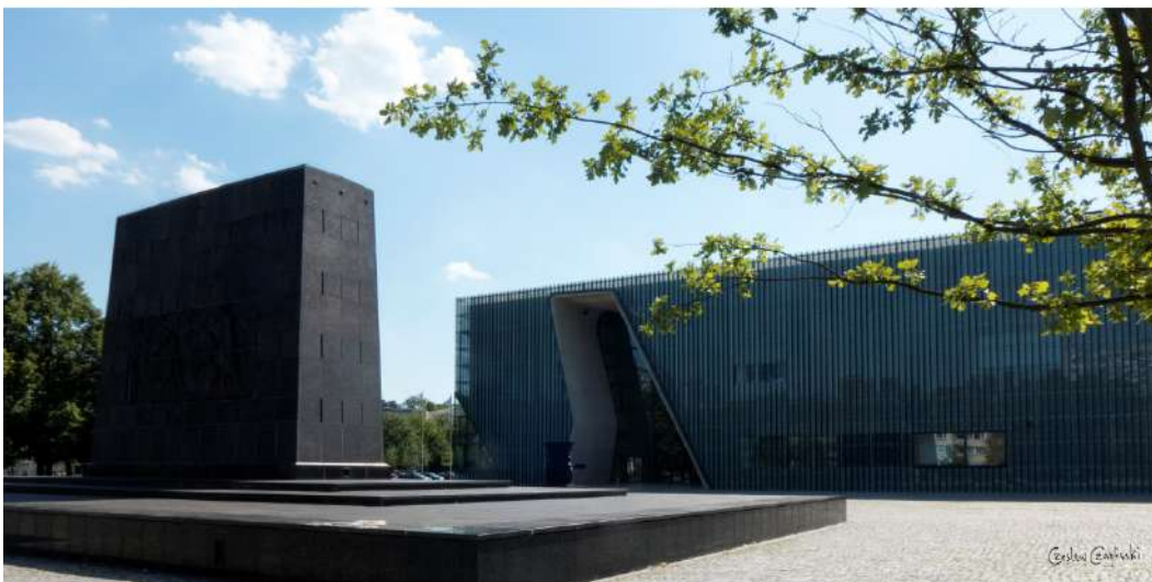
Pomnik Bohaterów Getta w Warszawie, w tle Muzeum Historii Żydów Polskich.