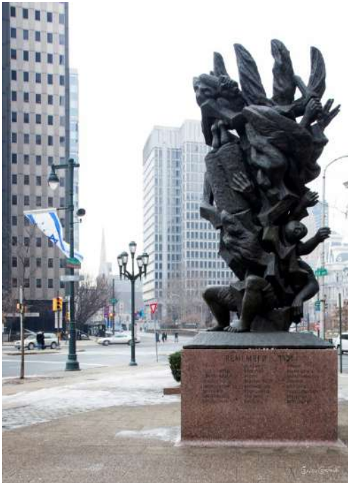
Pomnik Rapaporta pt. "Sześciu Milionów Ofiar Nazizmu" w kształcie płonącego krzewu (1964, brąz) w Filadelfii (USA).