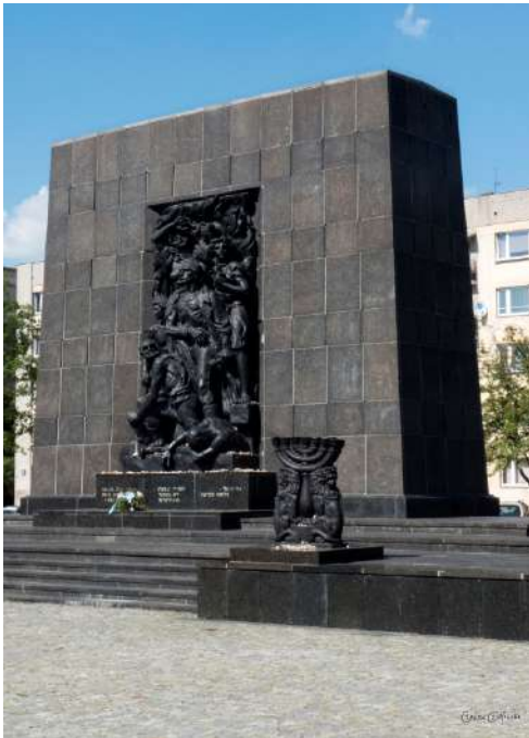
Pomnik Bohaterów Getta w Warszawie odsłonięty 19 kwietnia 1948 r.